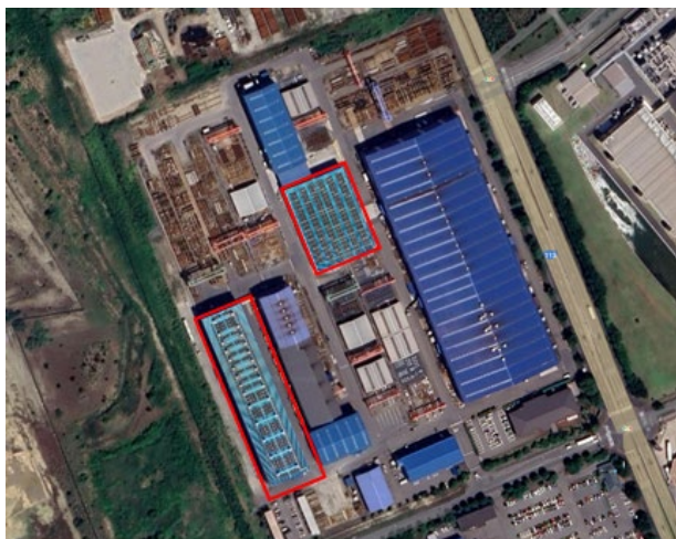
藤木鉄工東港工場 全景（パネル設置状況）

日本コムシス株式会社（本社：東京都品川区、代表取締役社長 田辺 博 以下、日本コムシス）は、子会社である藤木鉄工株式会社（本社：新潟県新潟市、代表取締役社長 小林 輝昭 以下、藤木鉄工）の東港工場（新潟県北蒲原郡聖籠町）の屋根に太陽光パネルを設置し、2025 年 1 月 29 日より太陽光発電を開始したことをお知らせいたします。