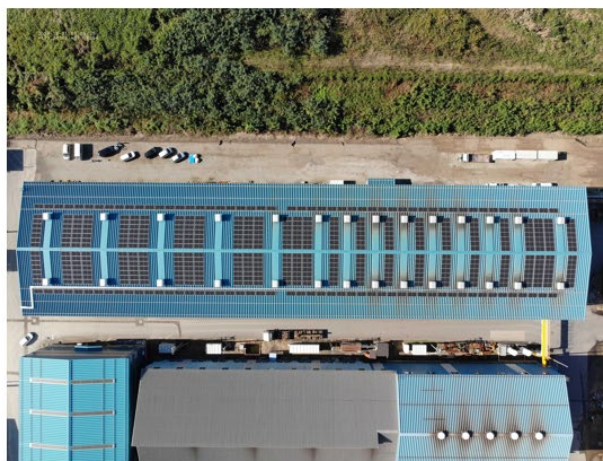
第 5 工場（パネル設置状況）