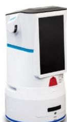
デリバリーロボット NAOMI-2