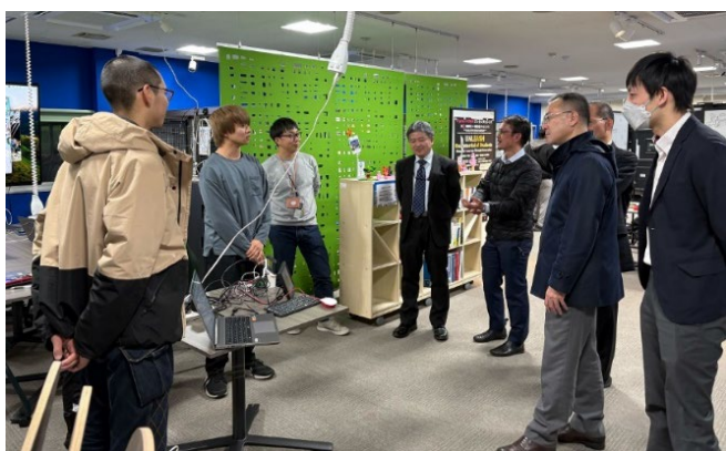
小山工業高等専門学校 訪問の様子